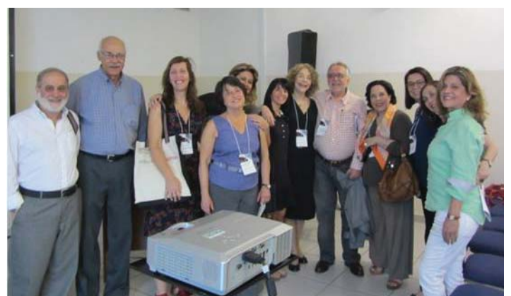
O clima afetivo do Congresso

A equipe editorial relacionou os nomes acima com base na programação científica e indicação dos colegas participantes. Caso identifique alguma omissão, desculpem-nos pelo erro, e, por favor, comunique através do email sbprj@sbprj.org.br