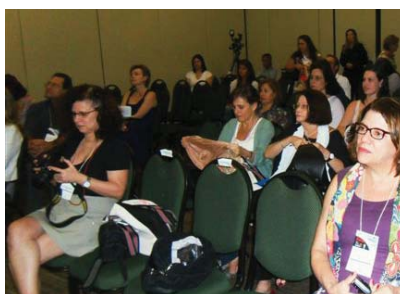
Entre colegas, nossa fotógrafa Sandra