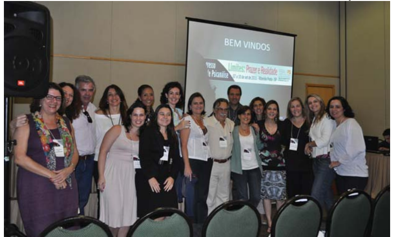
Emoção da Brasileira: Premiações