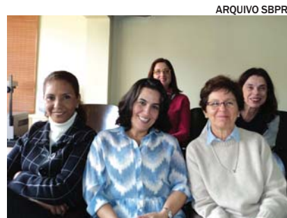
Jornada de Formação Psicanalítica