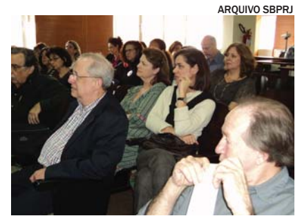
Jornada de Formação Psicanalítica