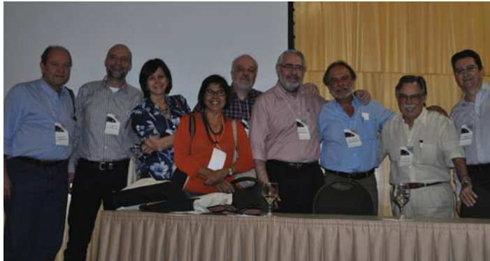
Uma turma de peso