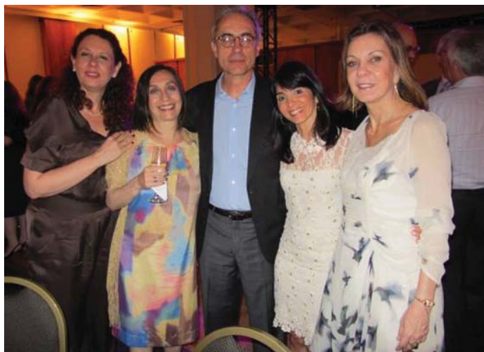
Festa em Ribeirão