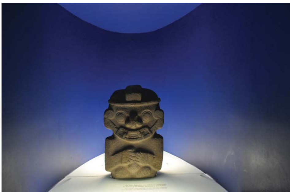
Museu do Ouro, Bogotá

dizer de uma Catedral de Sal? ou de avenidas que recortam a cidade pelo alto das montanhas - aliás, quem sabe a diferença entre "carrera" e "calle"? ou das ladeiras da Candelaria? do Museu Botero? do Museu do Ouro? Bogotá foi também personagem do Congresso da Fepal. As cidades são sempre personagens nos encontros. Por vezes diretamente implicadas, por vezes como moldura, ajudam a compor o clima onde os encontros se dão.